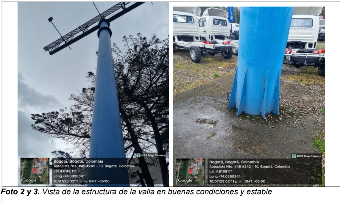
Foto 2 y 3. Vista de la estructura de la valla en buenas condiciones y estable