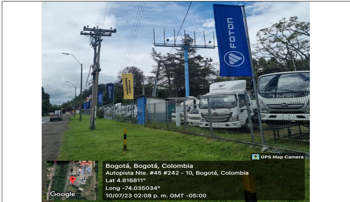
Foto 1. Vista panorámica del predio y de la estructura de la valla ubicada en la Av. Carrera 45 No. 242-10 (dirección catastral) orientación SUR - NORTE.